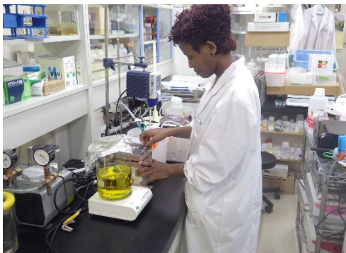
図1 吸着剤の合成風景

天然温泉など日本の地下水にもフッ素やヒ素などの自然由来の有害イオンが含まれることがあり、利用・排出するためには水処理が必要です。そこで、私たちは複数の金属の含水酸化物を組み合わせた複合含水酸化物に注目し、低濃度の有害イオンを除去するための新しい「吸着剤」の開発に取り組んでいます（図1、2）。これまでにフッ素とヒ素の吸着剤を開発してきました。これからも、世界中の人々が安心して水を利用できるように貢献したいと考えています。