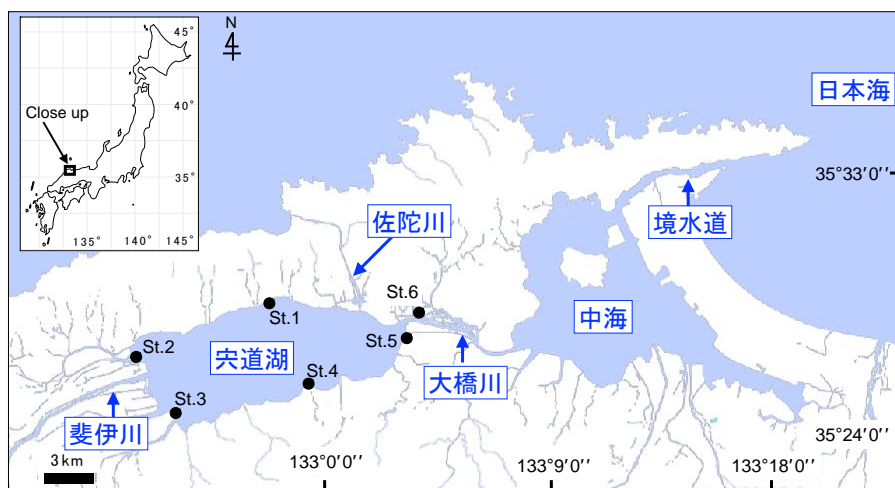
図 1: 継続的な eDNA モニタリング調査を実施した宍道湖沿岸の 6 地点 (St.1~St.6)。

環境 DNA (eDNA) の分析は、河川、池、湖などの水サンプルに含まれる DNA 情報を手がかりにして、eDNA の検出/不検出や濃度を解析することで、対象種の在不在や生物量 (バイオマス) を簡便に推定することができます。eDNA のもう一つの利点は、現場で収集するのは水だけで済むため、現地調査に必要な労力を大幅に削減でき、長期的かつ高頻度でのデータ収集が容易になることです。また、沈水植物の生息確認は水面に葉などが到達するまで視覚的に把握するのは難しいですが、湖底の殖芽 (栄養分を貯蔵した芽) などから放出される eDNA は、水中でまだ発芽段階にある場合でも検出できる可能性があり、沈水植物の早期発見を可能にするかもしれません。そこで、宍道湖におけるツツイトモとリュウノヒゲモの大量繁茂の要因解明を目指した長期的な eDNA モニタリング調査を実施しました (図 1)。