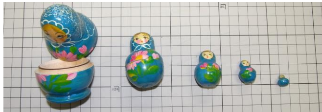
図：身近なフラクタル構造であるロシアの民芸品、マトリョーシカ。

自分の図形の中に自分自身と相似（自己相似）な図形を内包している構造をフラクタルといいます。ロシアの民芸品であるマトリョーシカのような構造のことで、人形の中を開けるとまた人形が、その中にまた人形が入っています。このフラクタルを特徴づけるために、フラクタル次元 D_f (fractal Dimension) を用います。フラクタルを有する図形の大きさ ( y ) の分布は距離 ( x ) に対して「ベキ乗則： y = ax^{-D_f} 」で表され、両対数プロットの傾きから D_f を求めることができます。