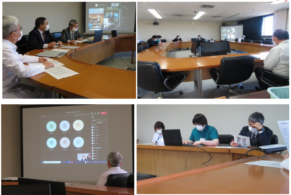
オープニングミーティング・クロージングミーティングの様子