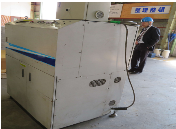
HDD, USB 等移動式破砕処理機械(江島工場)