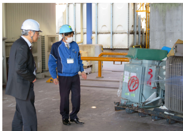
低濃度 PCB の抜油後の機器(トランス等) この後焼却炉へ(潮見工場)