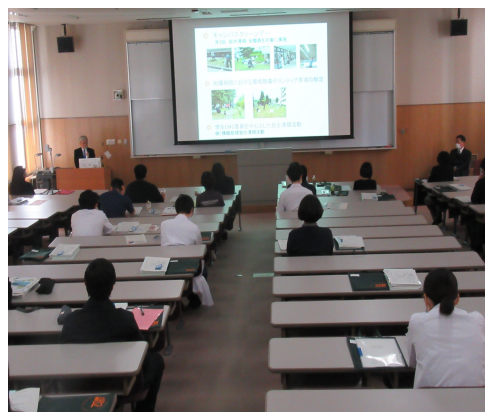
大学院新入生オリエンテーション研修