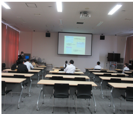
医科研修医・歯科研修医研修

また、5月には全職員対象の EMS 基本研修を計画していますので、是非ご参加ください。