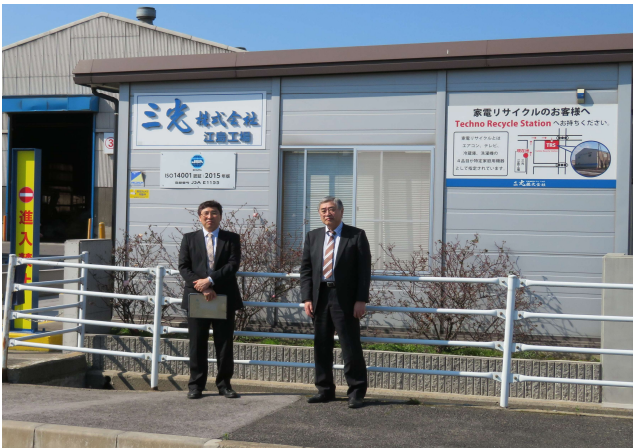
江島工場看板前にて

なお, それぞれの工場で見学ごとに管理責任者による管理ポイントを定め実践していることや各種設備点検を行い, 適切な環境で作業されていることが確認できました。