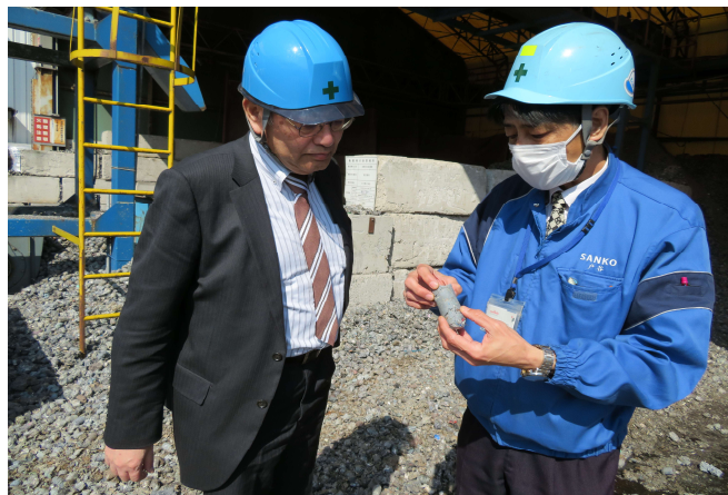
PRF(固形燃料)の現物説明(江島工場)