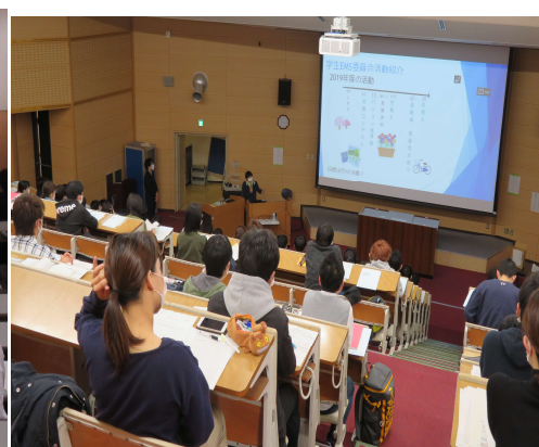
学部新入生オリエンテーション研修