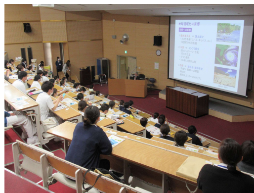
新任看護師，医療職員研修