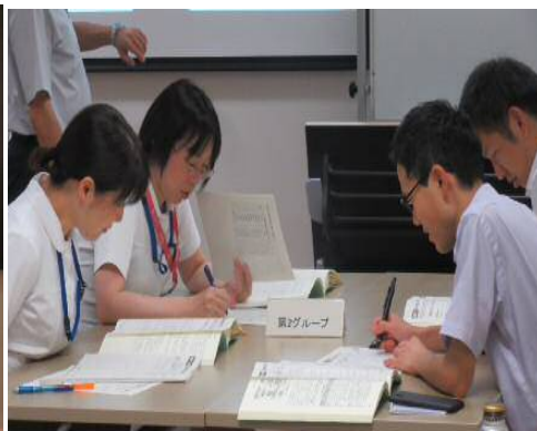
ケーススタディの様子