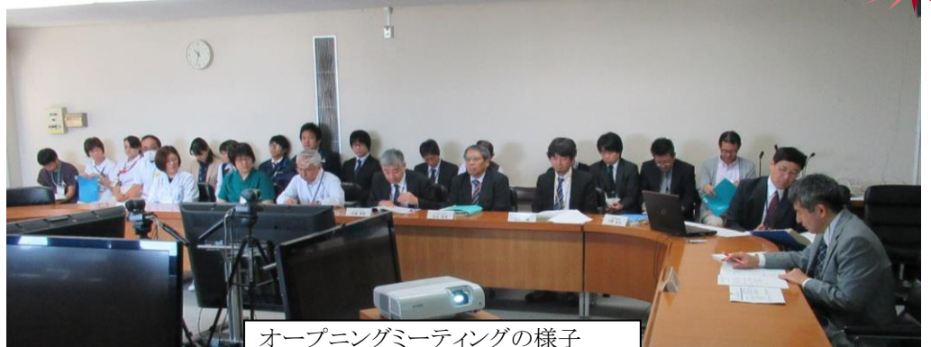
オープニングミーティングの様子