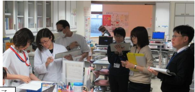
実際の監査の様子