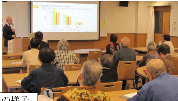
市民公開講座の様子