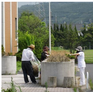
キャンパスクリーンの様子