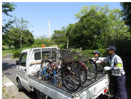
自転車撤去の様子